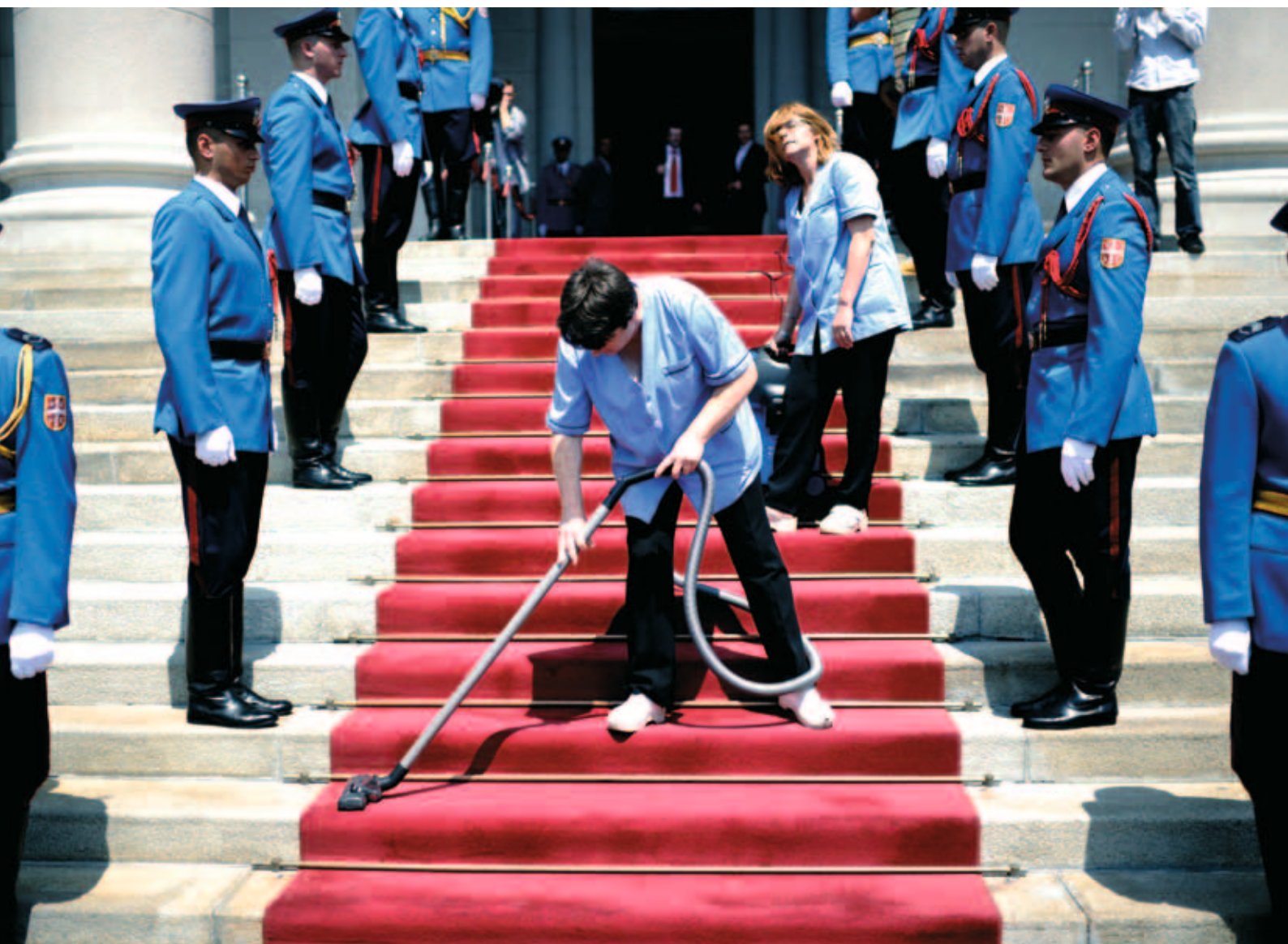
Autor fotografije: Nemanja Pančić